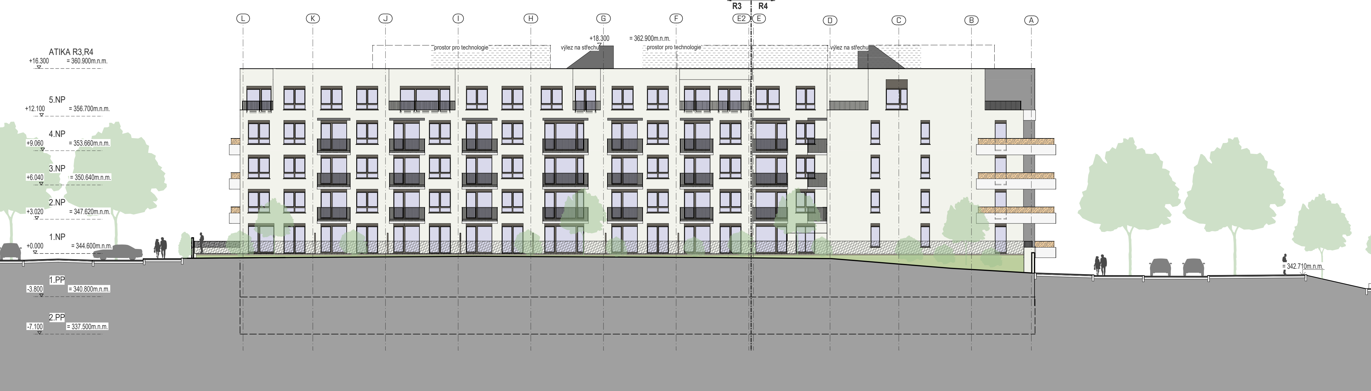
POHLED OD SEVEROZÁPADU