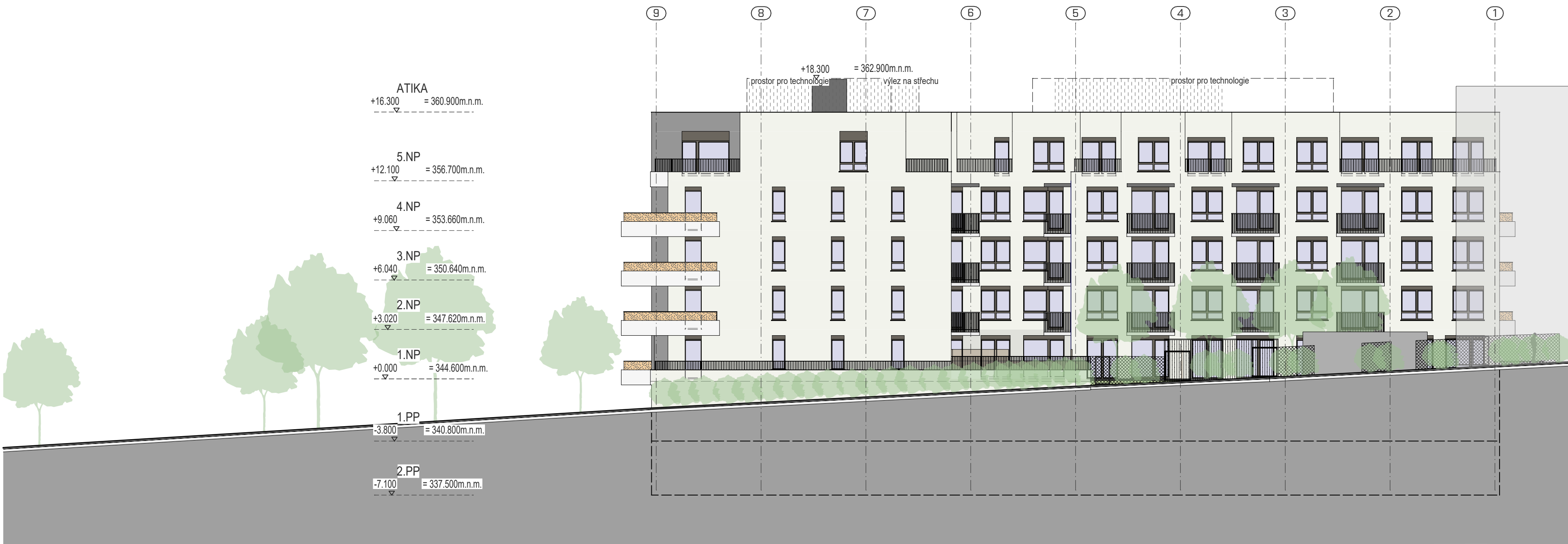
POHLED OD SEVEROVÝCHODU